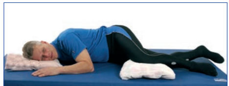
Aseta tynny polven alle.