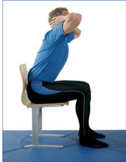
Nouse ylös pää ja yläselkä edellä ojentaen selkää. Voit alussa auttaa käsillä reisistä työntäen.