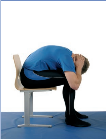
Kumarru eteenpäin selkä pyöreänä.

Tee liikkeet rauhallisesti. Tehosta liikkeitä hengittämällä liikkeiden aikana syvään ja aktivoi syviä vatsalihaksia liikkeen aikana. Toista liikkeet 8-12 kertaa.